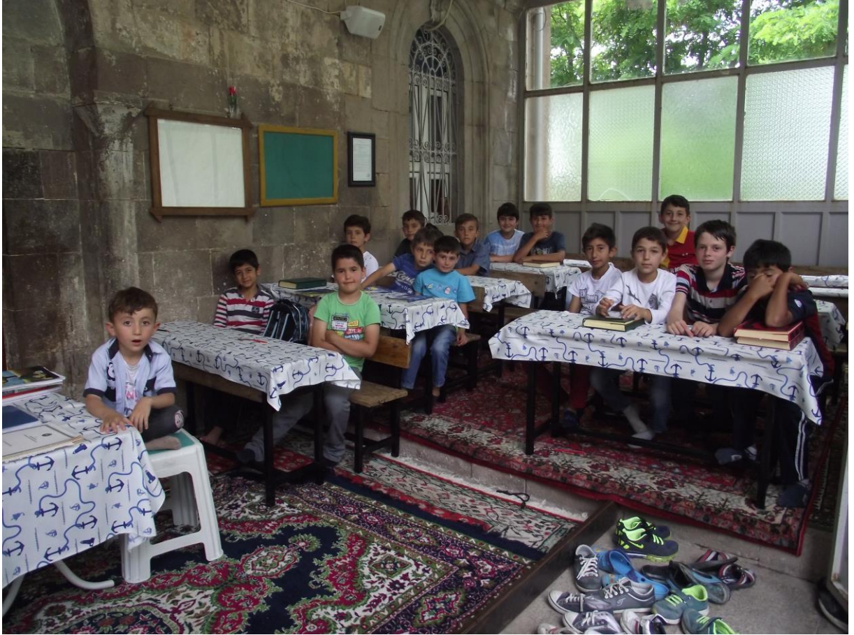
2016'da Çektiğim Fotoğrafta Allah Kulu Camiinde Kur'an-ı Kerim Öğrenen Çocuklar