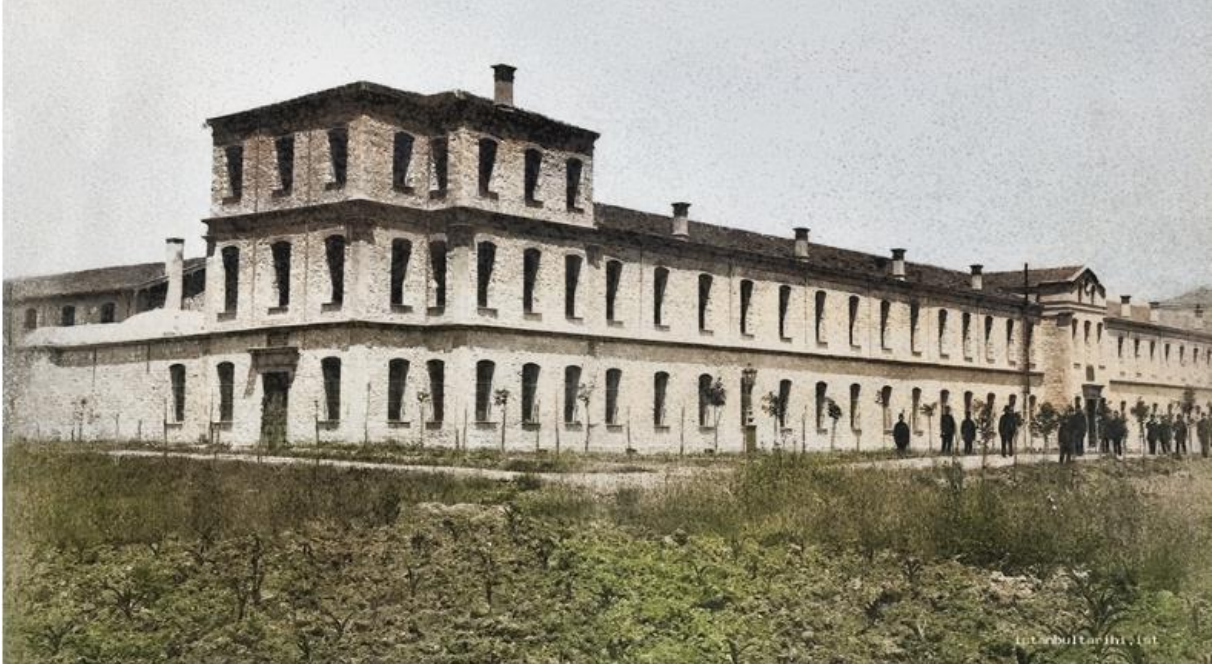
Halkalı Ziraat Mektebi

Yapılan öneriden ciddi bir altyapı çalışması yapılmış olduğu anlaşılmaktadır. Dünyanın muhtelif yerlerinde bulunan söz konusu hayvanların cins olanlarından satın alınarak getirilmesi ve bu işler için oluşturulacak çiftliklerde yetiştirilip çoğaltılması ele alınmıştır. Bu iş için İstanbul, Bursa, Konya ve Sivas öne çıkmaktadır. İstanbul'da ise Halkalı Çiftliği önerilmiştir. Merak eden detaylarını okusun.