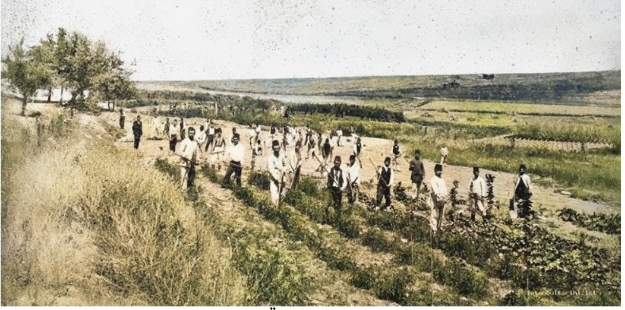
Halkalı Ziraat Mektebi Öğrencileri Uygulama Çalışmasında

ve duhuliyeden hâsıl olacak mebalîğ karşılık tutulup üst tarafı dahi Ziraat Bankası Şubelerinin merkeze aid olan sülüs hisse esmanından ifa kılınacaktır.