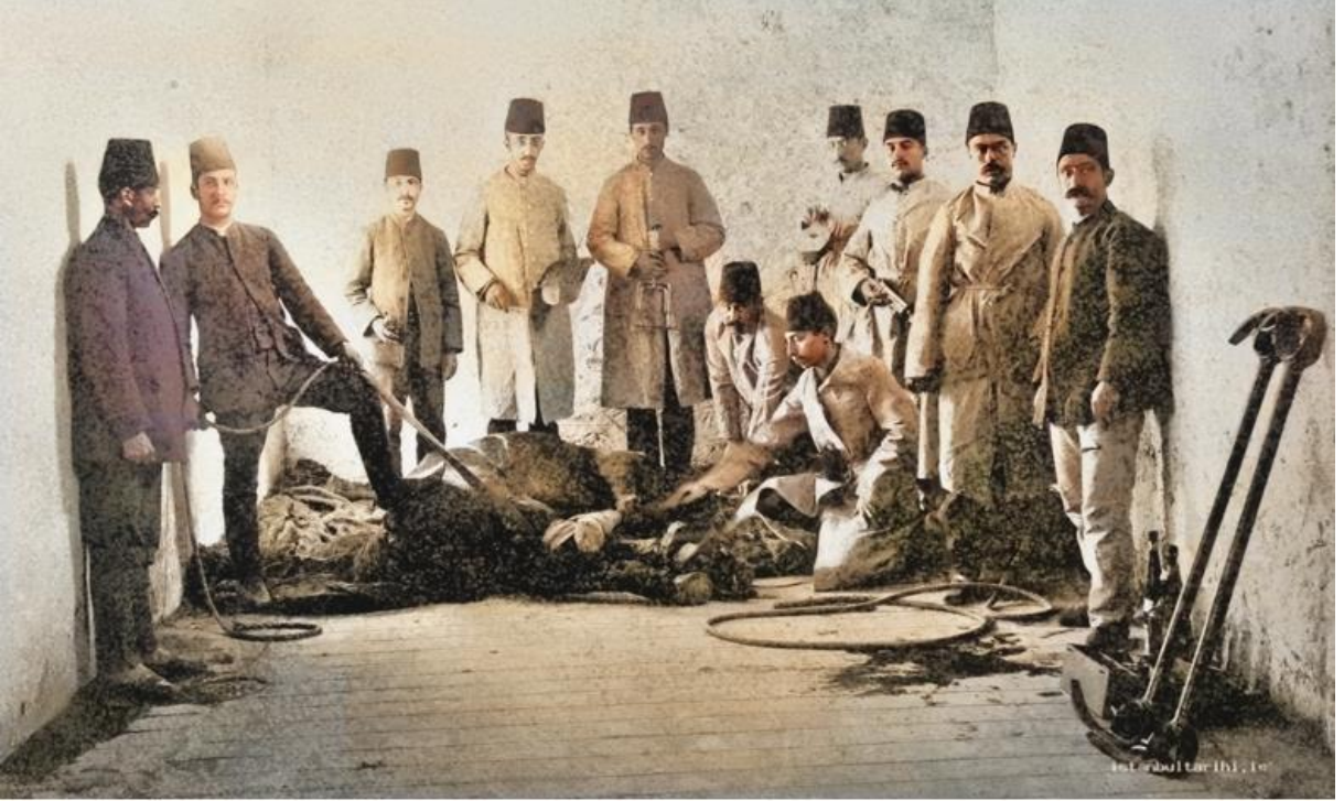
Halkalı Ziraat Mektebinde Baytarlık Öğrencileri Uygulamalı Derste